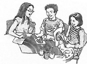
Estos estudiantes hacen un proyecto de arte.