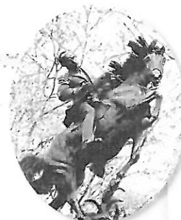
Una estatua de José Martí en la ciudad de Nueva York