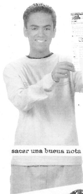
sacar una buena nota

66 ¡Hola! Me llamo Miguel. En mi escuela siempre estamos muy ocupados. Vamos a ver lo que hacemos en las clases 99.