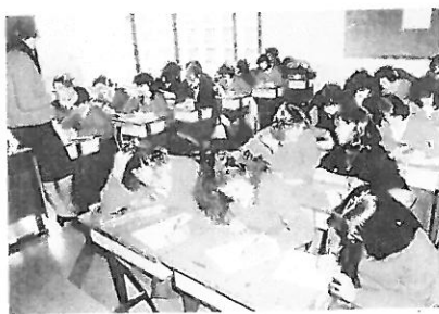
Estas estudiantes están tomando apuntes (taking notes) en su clase de historia.