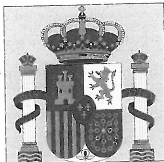
Figura 1 Éste es el escudo del Reino de España. En la parte de arriba está la corona (crown) de los reyes.